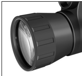
5X50 Art.No.: 90-75500