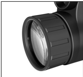
3X25 Art.No.: 90-75000